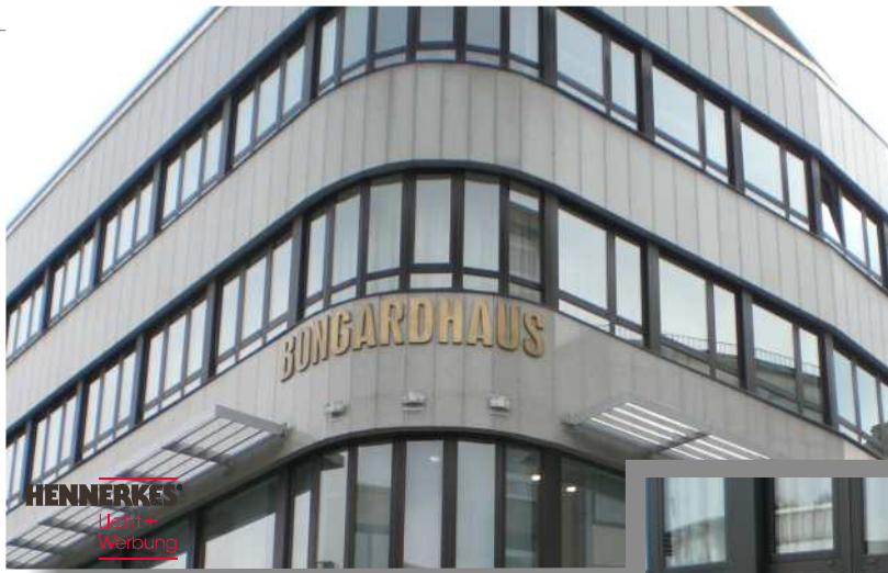
Messing-Buchstaben, Profil 01 (mit Böden)