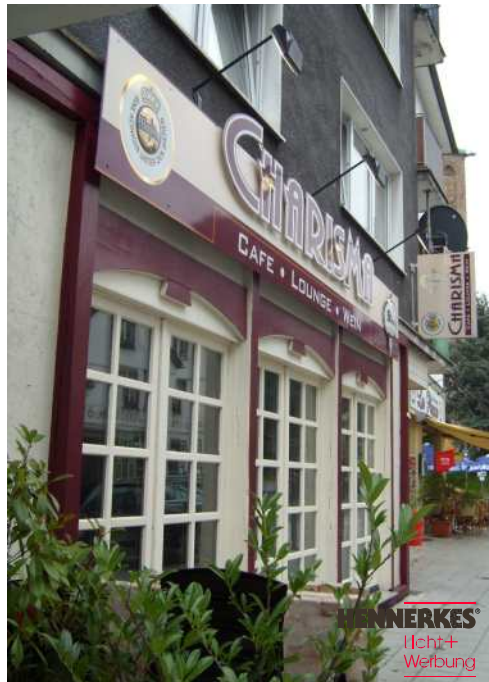
KS-Buchstaben mit Fassaden-Gestaltung