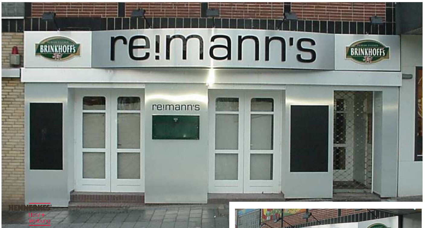
KS-Buchstaben, durchgefärbt Fassaden-Verkleidung in Edelstahloptik (Butlerfinish)